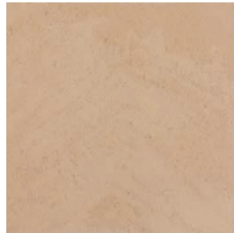
MT 8 / подложка 8Y1510