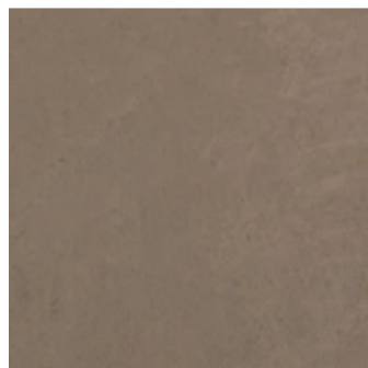
MT 11 / подложка 6Y1030