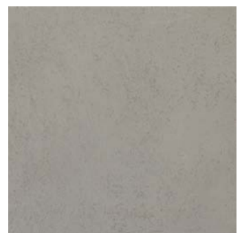
MT 5 / подложка Y0020