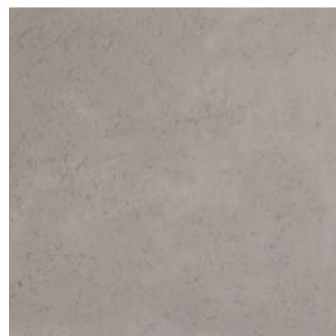
MT 12 / подложка N0020