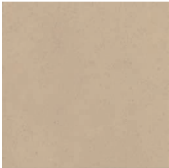
MT 6 / подложка 4Y1510