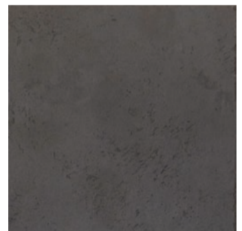
MT 13 / подложка N0060

* Представлена палитра базовых цветов Микроцемента. Обратите внимание, что образцы на стенде покрыты Матовым Аква-Лаком, который влияет на финальный цвет покрытия, немного высветляя его. Это стоит учитывать при заказе колерованного материала. Микроцемент может быть заколерован в любой цвет. Из-за особенностей цветопередачи мониторов цвета могут отличаться от оригинальных.