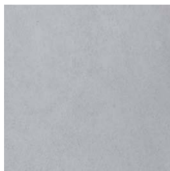
MT 3 / подложка 9R0010