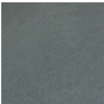
MT 10 / подложка 7B1040