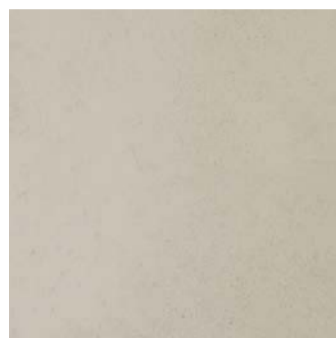
MT 4 / подложка Y0010