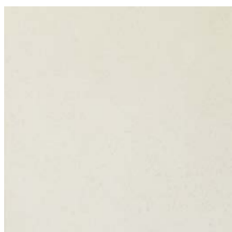
MT 2 / подложка 1Y0005