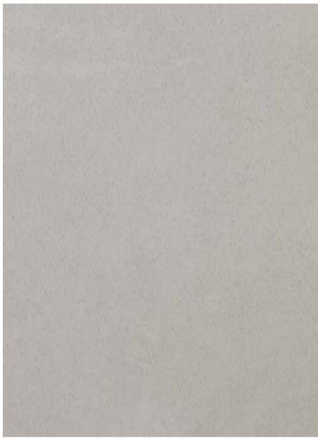
MT 1 / подложка N0030