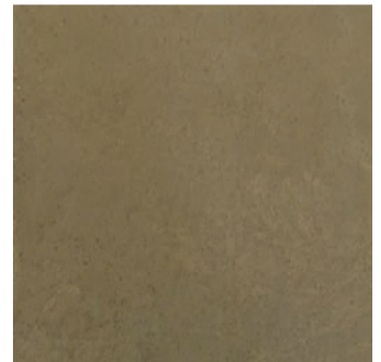
MT 9 / подложка 1Y1040